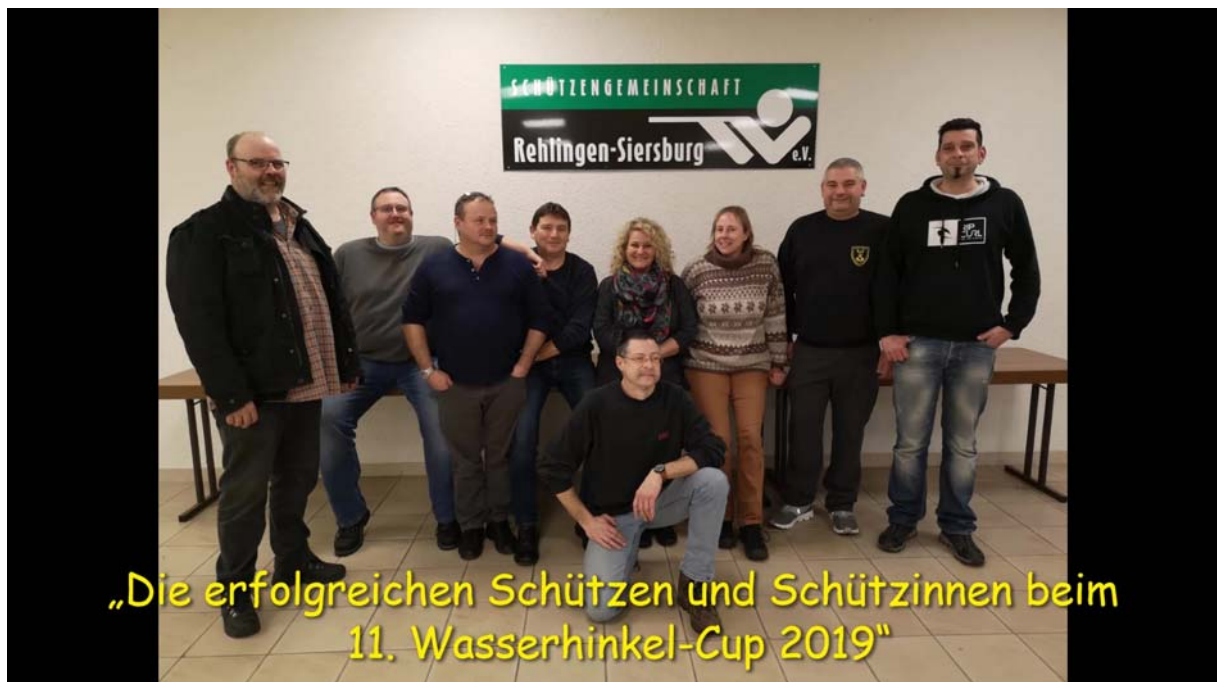
„Die erfolgreichen Schützen und Schützinnen beim 11. Wasserhinkel-Cup 2019“